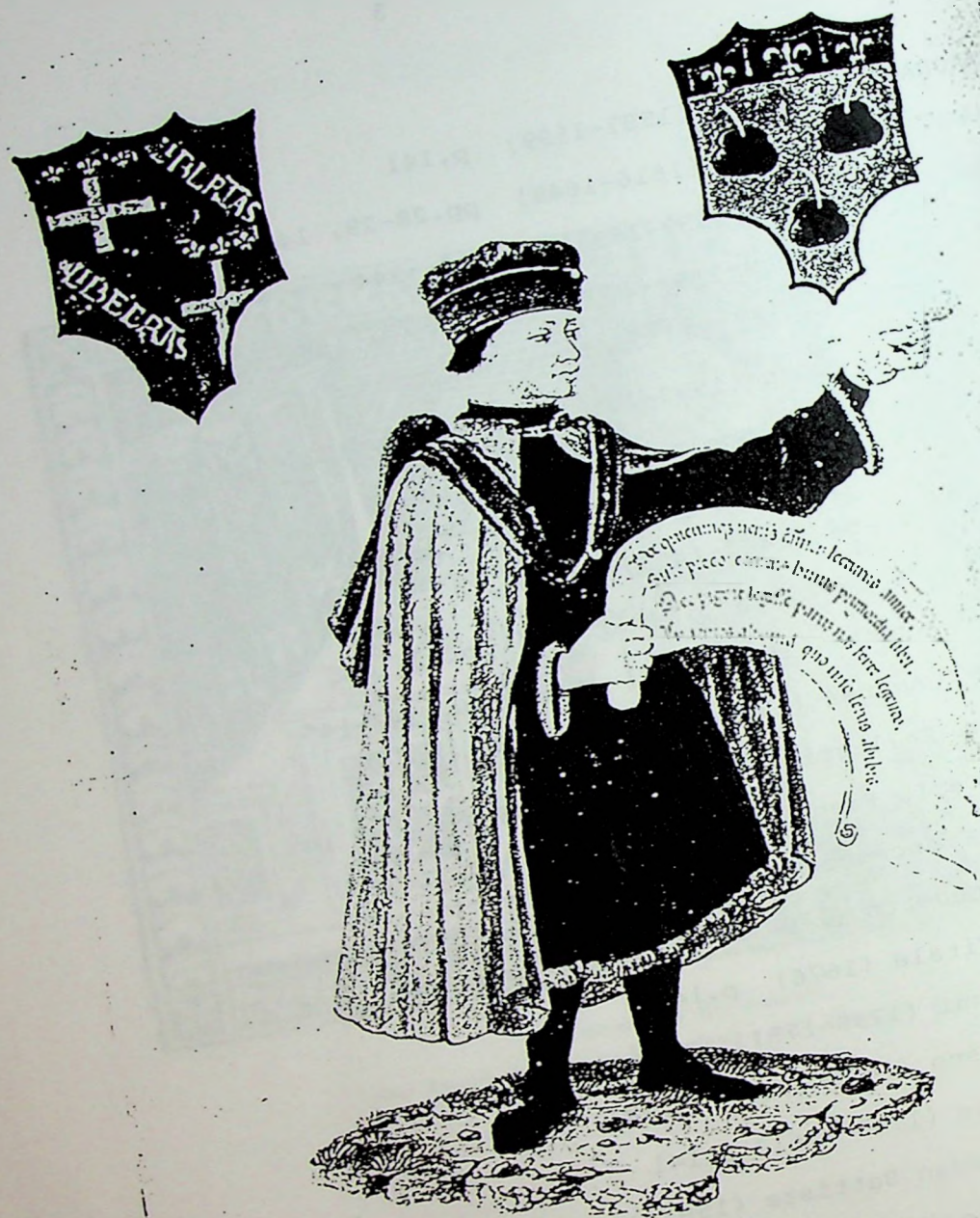
Il notaio. (Bologna, Museo civico, ms. 95).